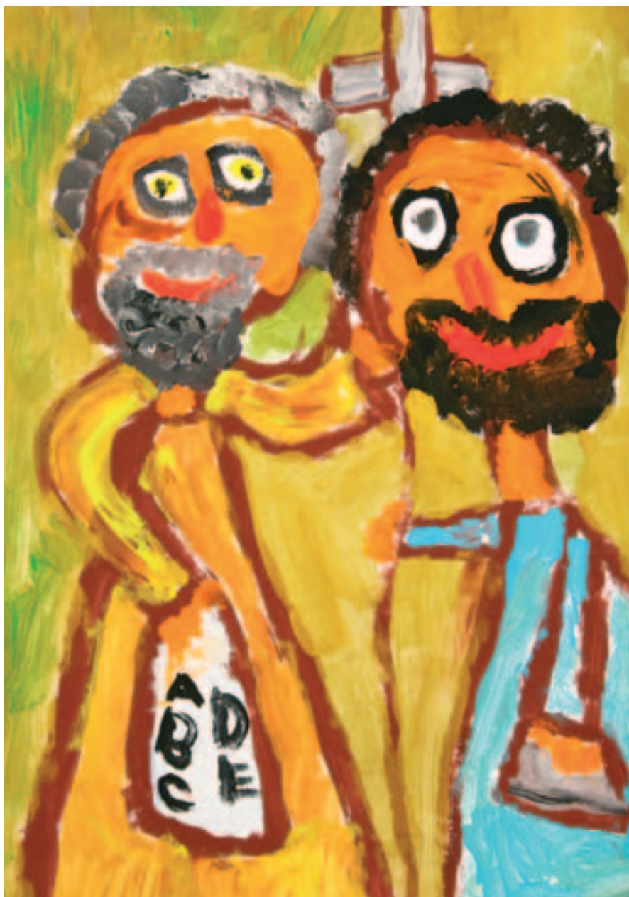
1. Sára Pavlendová 91. MŠ Jesenická, Plzeň, 6 let