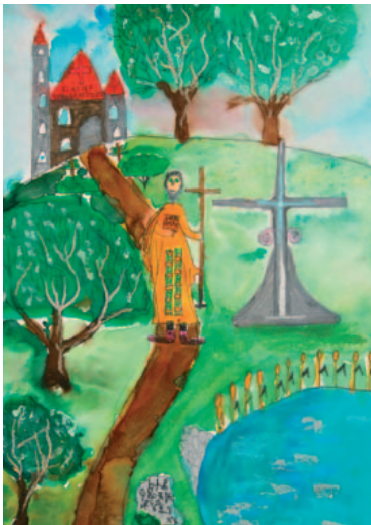
5. Francesco Sanvito ZŠ Na Výběžku, Liberec, 10 let Cyril vymýšlí hláholici