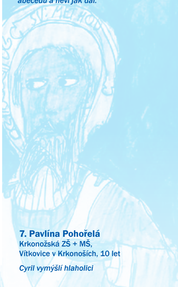
7. Pavlína Pohořelá Krkonožská ZŠ + MŠ, Vítkovice v Krkonoších, 10 let Cyril vymýšlí hlaholici

Odehrává se to v Cyrilově pracovně. Cyril píše hlaholickou abecedu a neví jak dál.