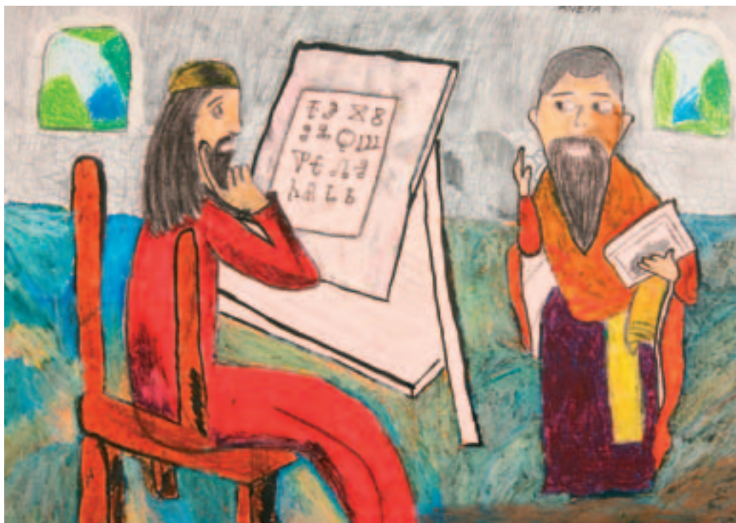
10. Aneta Hrudníková ZUŠ M. Stibora, Olomouc, 5. třída