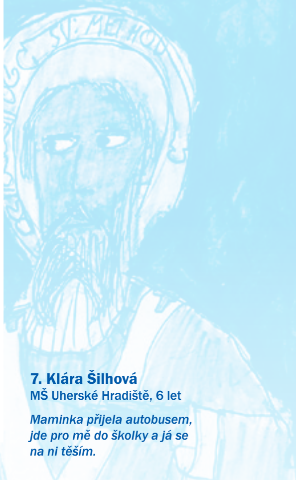
7. Klára Šilhová MŠ Uherské Hradiště, 6 let

Maminka přijela autobusem, jde pro mě do školky a já se na ni těším.