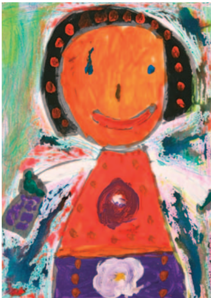
4. Karolína Viciánová MŠ Jalubí, 6 let