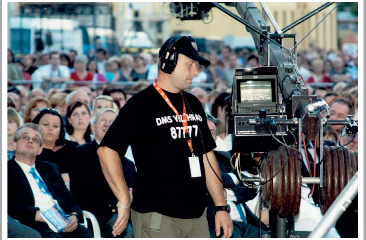
Žánrová kategorie: Fotografická reportáž Ocenění: 2. místo v kategorii Fotografická reportáž