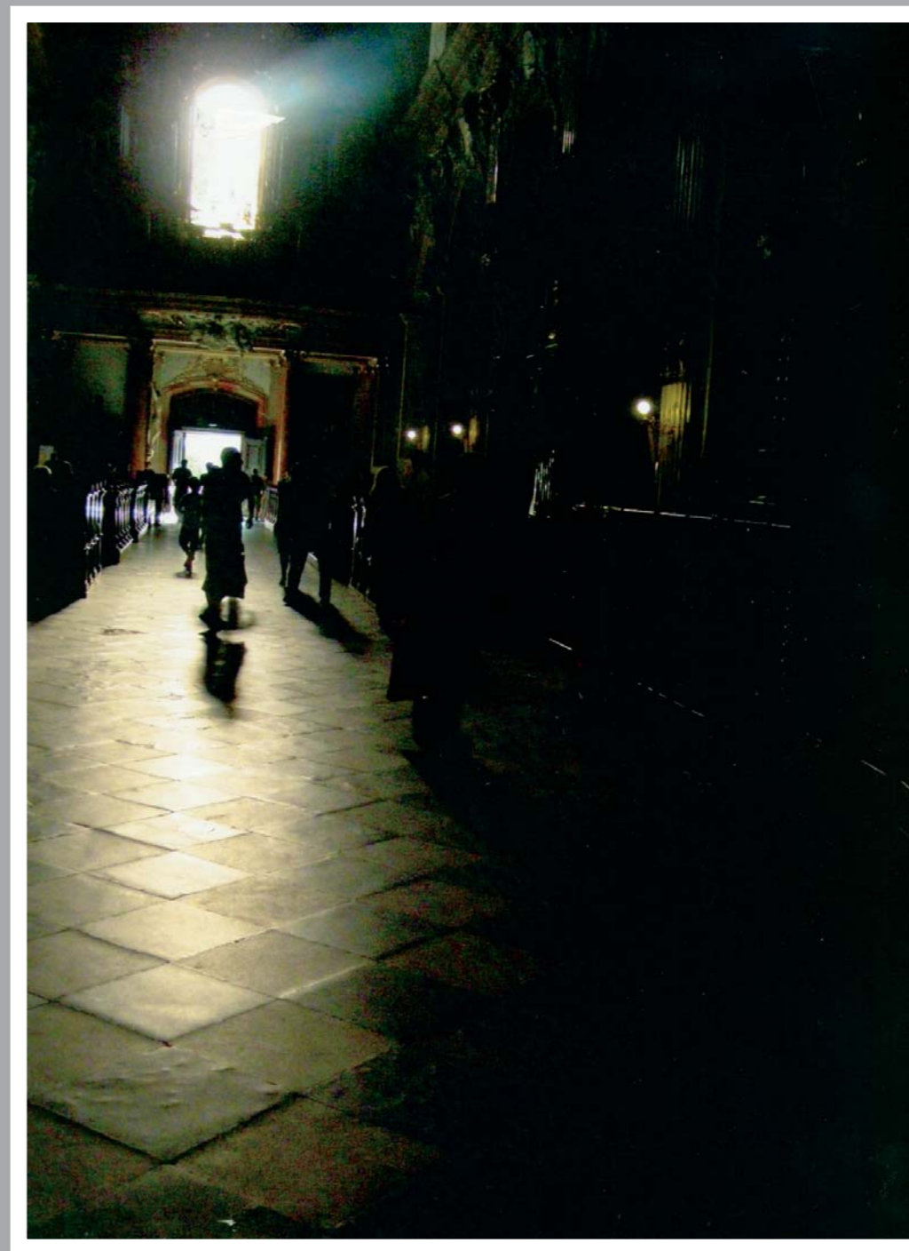
Autor: Dušan Nečas Žánrová kategorie: Portrét Ocenění: 3. místo v kategorii Portrét