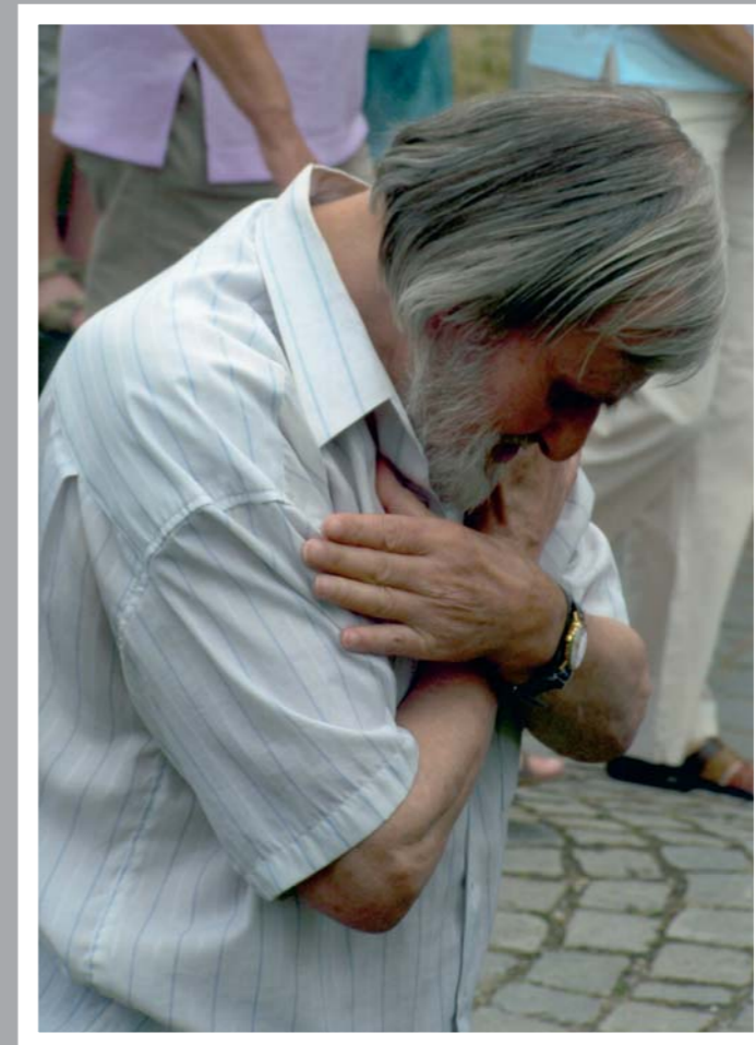
Autor: Filip Fojtík Žánrová kategorie: Portrét Ocenění: 1. místo v kategorii Portrét