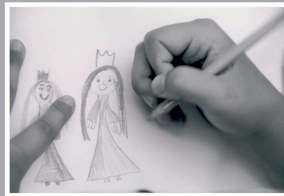
Autor: Dušan Nečas Žánrová kategorie: Výstavní soubor Ocenění: 3. místo v kategorii Výstavní soubor