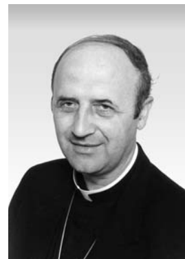
Jan Graubner, arcibiskup olomoucký

Děkuji všem, kteří velehradské Dny lidí dobré vůle připravují, a všem účastníkům přeji nejen krásné zážitky při různých programech, ale i chuť a odvahu přijmout pozvání k otevření Bible, kterou svatí bratři kdysi zpřístupnili našim předkům překladem do slovanského jazyka, a tak jim pomohli vstoupit mezi vyspělé kulturní národy Evropy.