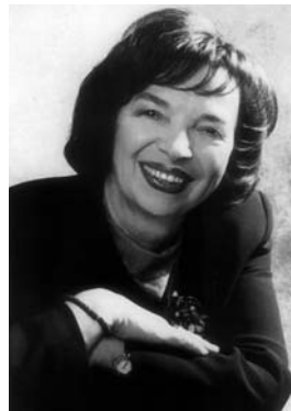
Livia Klausová, manželka prezidenta ČR

Přeji všem, aby se letošní Dny lidí dobré vůle vydařily a staly se inspirací pro každého jednoho z nás.