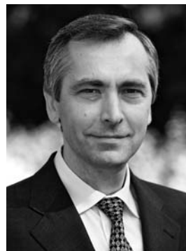
Ján Figel, člen Európskej komisie

Som rád, že v tomto duchu a zmysle sa moravský Velehrad a slovenská Nitra nanovo spájajú v rámci Dní ľudí dobrej vôle. Púť a sv. omše, koncerty, semináre a sprievodné akcie v oboch mestách sú nielen duchovnou oslavou a prehliadkou súčasnej kultúry, ale aj cestou k ľudskej vzájomnosti a solidarite. Dobrá vôľa spájajúca historickú skúsenosť, etiku zodpovednosti a pragmatickú víziu je základom aj pre európsky integračný proces, ktorého sme dnes plnou súčasťou. Práve návrat k slobode a vstup do rozšíreného domu Európskej únie je príležitosťou k oživovaniu spoločných, cyrilometodských koreňov národov Českej a Slovenskej republiky.