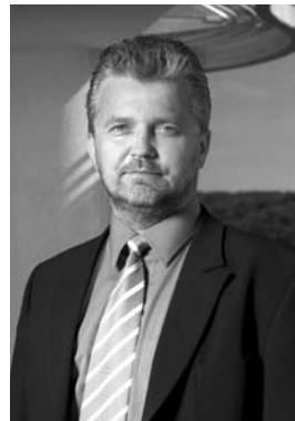
Libor Lukáš, hejtman Zlínského kraje